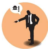
Nare opmerkingen maken