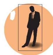
Iemand bewust in een isolement plaatsen