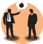
Beledigen of uitschelden