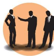
In het bijzijn van anderen iemand terechtwijzen