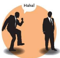
Grapjes maken over de rug van een ander