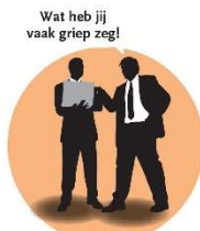
Kritiek uiten op iemands persoonlijke leven